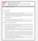
Fiche Echoppes et Maisons