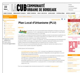
Dossier consacré au PLUi sur le site Internet de la CUB