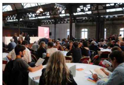
Les réunions publiques organisées à la CUB