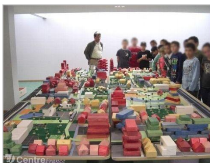
La maquette 3D utilisée par la CC Cœur de Puisaye

A la CC Cœur de Puisaye , il a été très bénéfique d'utiliser des supports 3D (représentant une ville) pour initier la discussion.