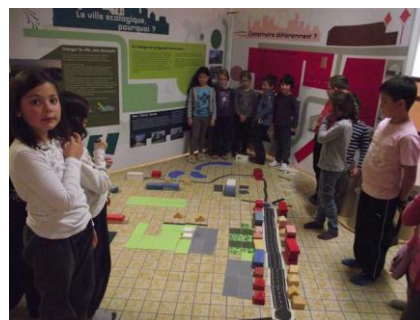
Le programme de la Semaine des Habitats Durables ; l'affiche de la soirée ciné-débat ; les ateliers pour scolaires