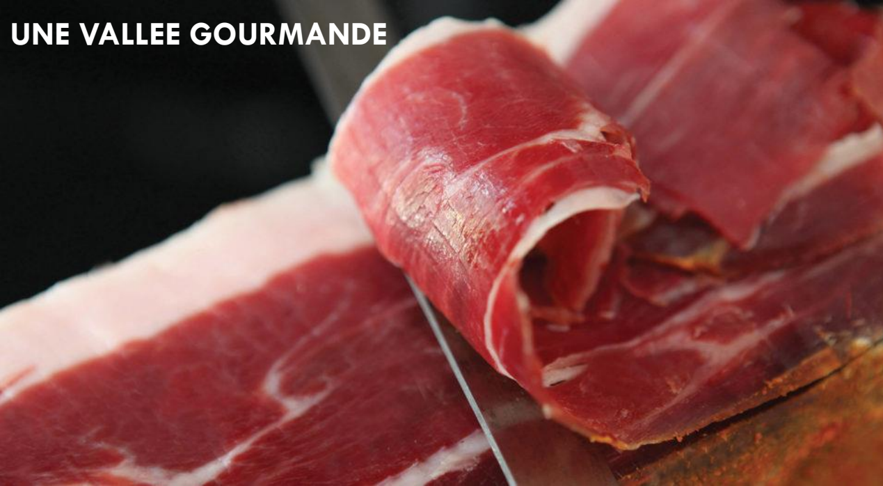
UNE VALLEE GOURMANDE