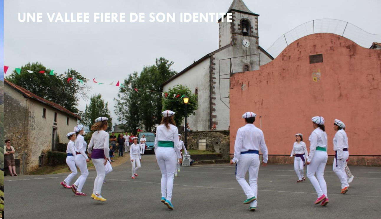
UNE VALLEE FIERE DE SON IDENTITE