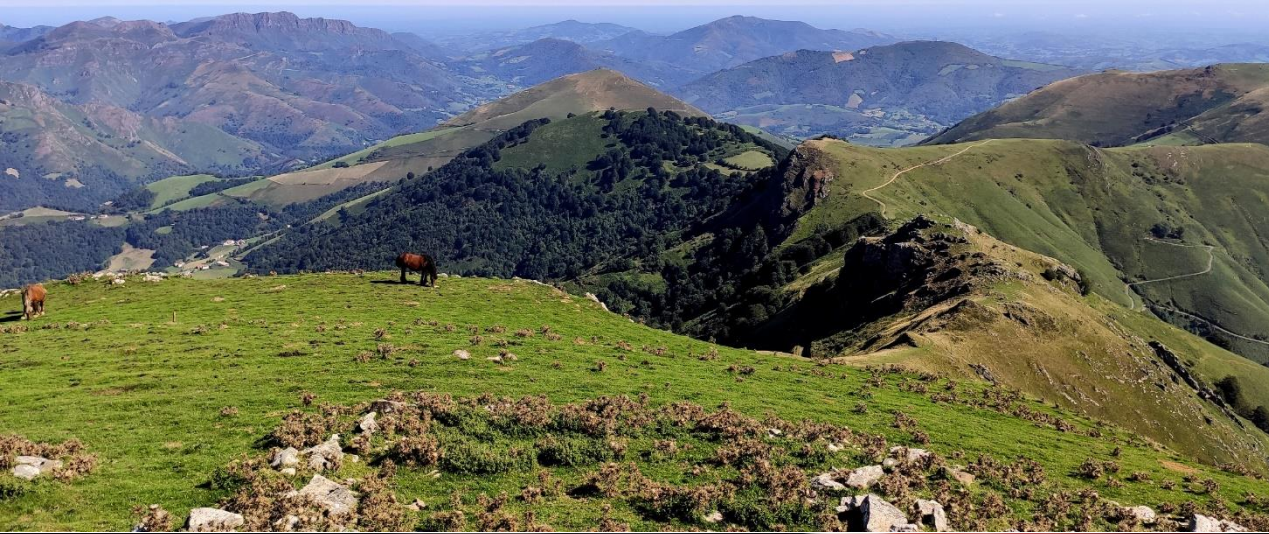
UN PETIT PARADIS COULEUR NATURE