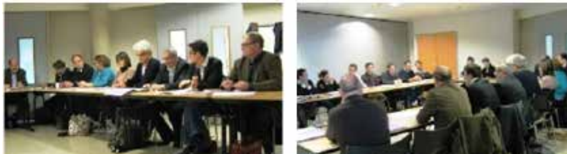
Le club territorialisé Bourgogne, à Matour, le 7 décembre 2012

De cette réunion ont été identifiés un certain nombre de questionnements sur :