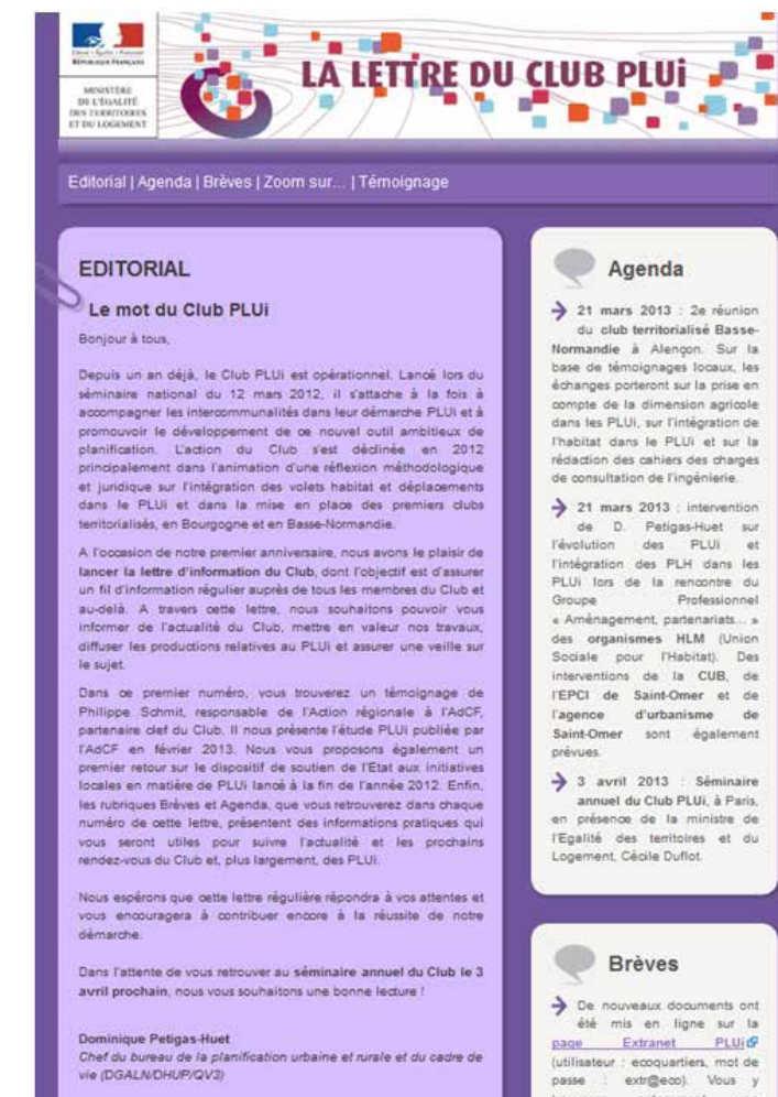
L'éditorial de la première lettre d'information du Club PLUi

De nouvelles rubriques pourraient voir le jour, pour faire du site un portail plus large d'une simple plateforme de téléchargement de documents.