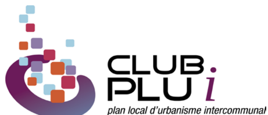
Le logo du Club PLUi

La mission communication de la DGALN, avec l'appui de la direction de la communication du ministère de l'Egalité des territoires et du Logement, a travaillé à renforcer l'identité graphique du Club PLUi. En restant proche des codes visuels du ministère, elle a donc créé un logo dédié au Club PLUi, qui symbolise le rassemblement et la concertation des participants au sein d'un groupe.