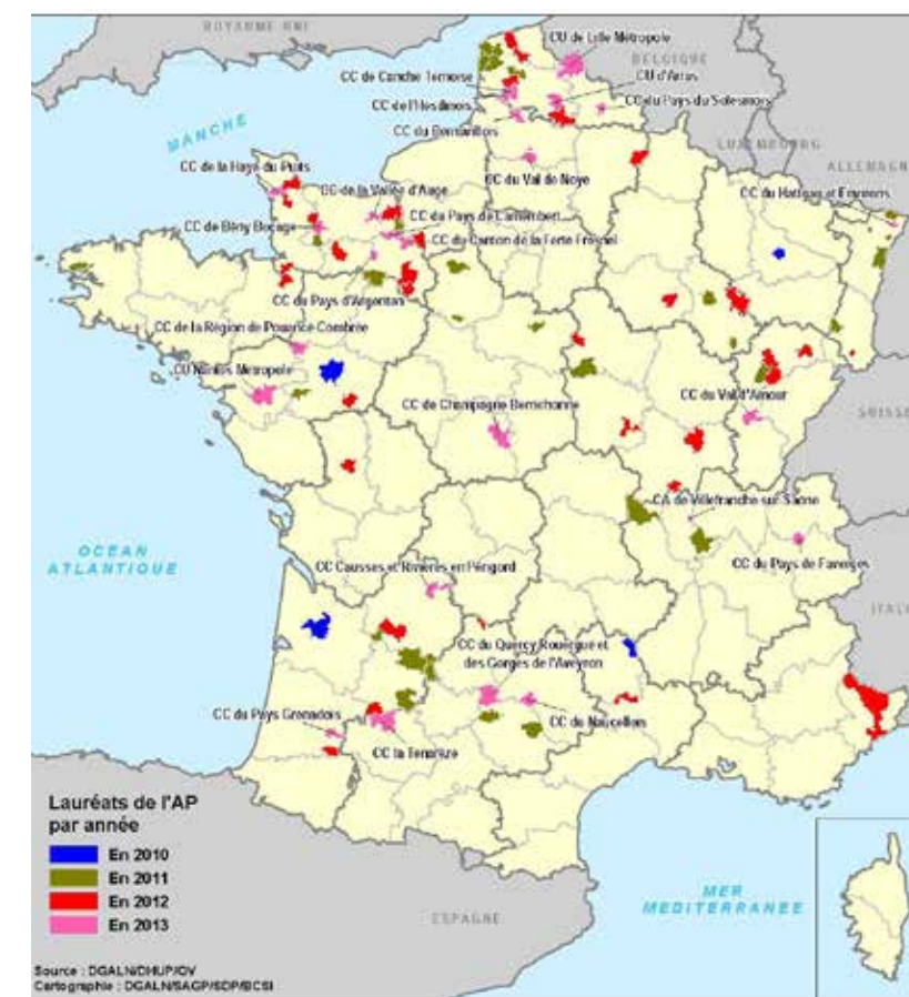
Carte de France des lauréats des soutiens aux initiatives locales PLUi (2010, 2011, 2012, 2013)