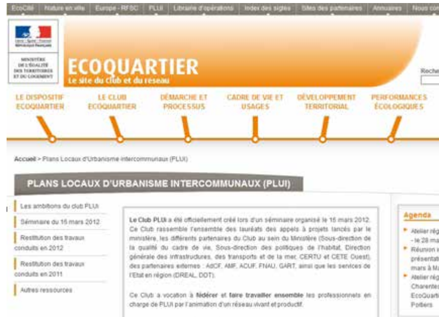
La page extranet du Club PLUi

http://www.e-lettre.developpement-durable.gouv.fr/la-lettre-du-club-plui/annee-2013/001/rubrique24785.html