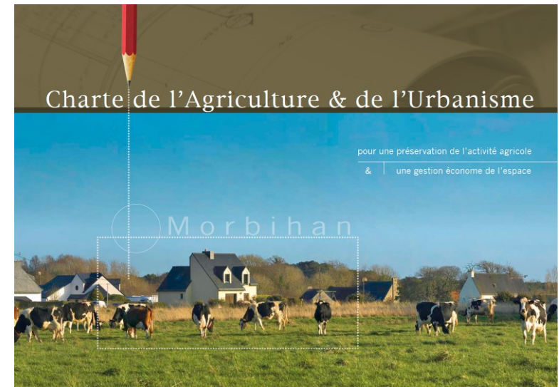
Charte AUT du Morbihan, réalisée par la Chambre d'Agriculture, la Préfecture, l'Association des Maires et Présidents d'EPCI, et le Conseil Général.

=> le partenariat ne se limite pas au diagnostic