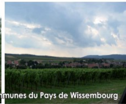
Plan Local d'Urbanisme intercommunal de la Communauté de Communes du Pays de Wissembourg